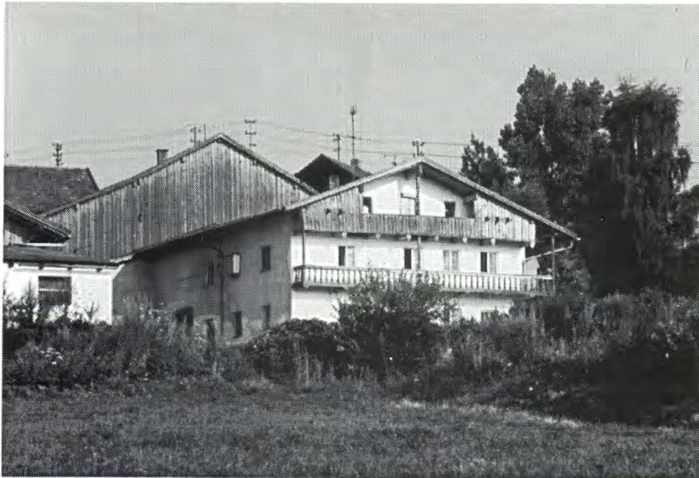
Casa natal de Thürriegel en Jossersdorf.