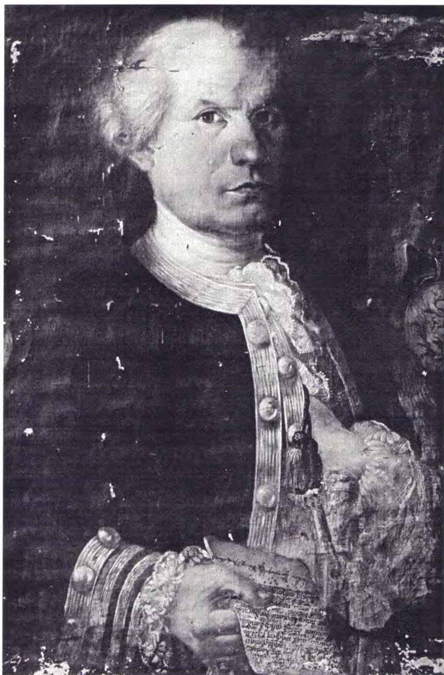
El Asentista Bávaro y Teniente Coronel Juan Gaspar de THÜRRIEGEL