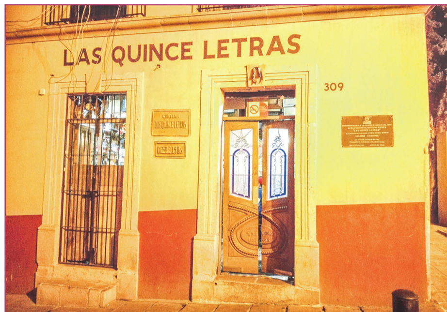
Las Quince Letras | A. L. Galiano

«El nombre de cantina pervivió años a través de algunos de sus sinónimos como tasca, bodega y taberna»