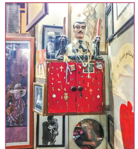
Las Quince Letras | A. L. Galiano

Esta visita nos hizo recordar aquellas cantinas oriolanas de nuestra infancia y juventud, que tenían su protagonismo en las tardes de los domingos y de las fiestas y que hoy añoramos. Sin embargo, `Las quince letras` nos han hecho vivir el respeto hacia las costumbres que completa el amplio panorama artístico y tradicional del pueblo zacatecano.