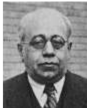
D. Manuel Azaña y Díaz, Presidente de la IIª República (11/V/1936-3/III/1939). [Fotografía de 1933].

El 29/V/1936, se envió un Telegrama de agradecimiento al nuevo Presidente de la República por haber enviado a esta Corporación Municipal un retrato suyo.