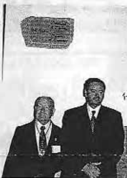
Una sencilla pero emotiva leyenda recordará para siempre a los Cronistas Oficiales de España

Quiero enviar un cordial saludo a todos los participantes en este XXVIII Congreso Nacional de la Asociación Española de Cronistas Oficiales y con el más sincero deseo para estas jornadas de trabajo y de encuentro en Altea.